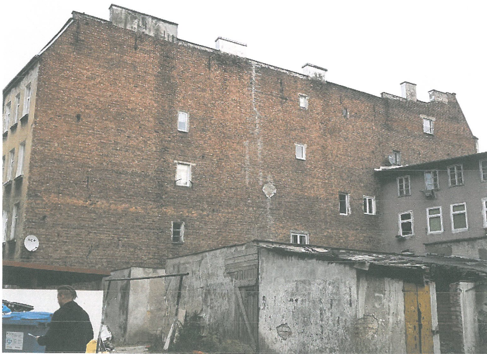
Fot.2. Gdańsk, budynek mieszkalny ul. Łąkowa 6 – elewacja boczna lewa, stan obecny.