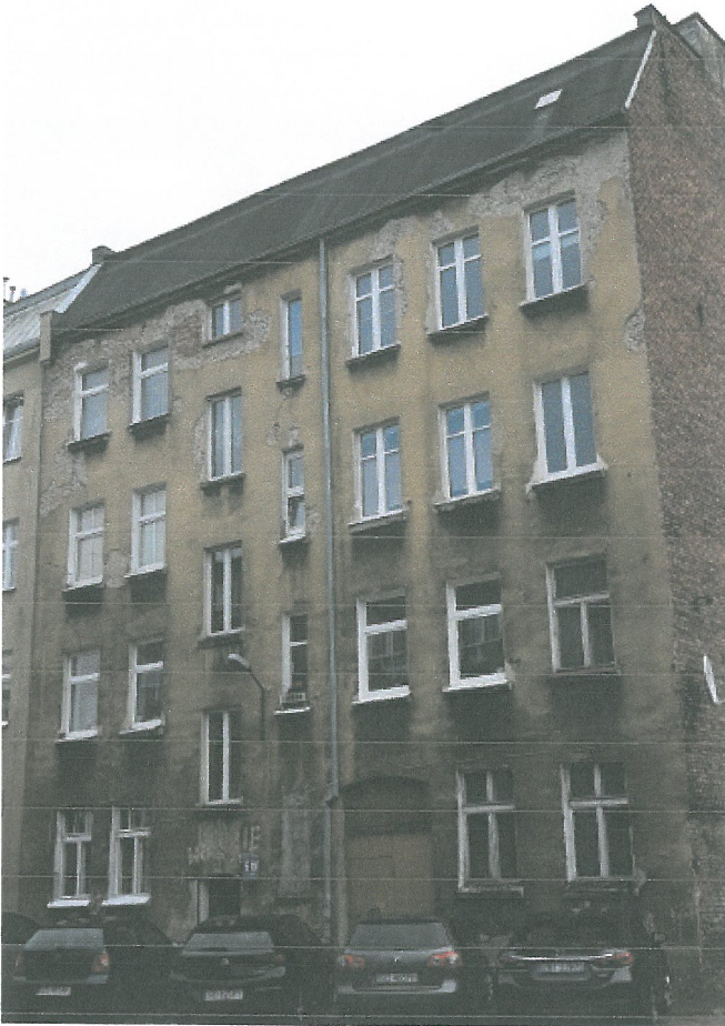
Fot.1. Gdańsk, budynek mieszkalny ul. Łąkowa 6 – elewacja tylna, stan obecny.